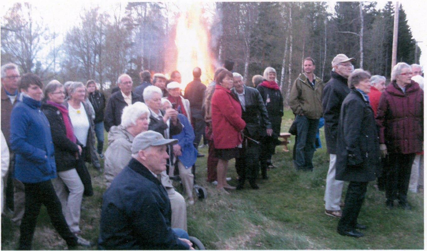
Valborgsmässofirande 2012.