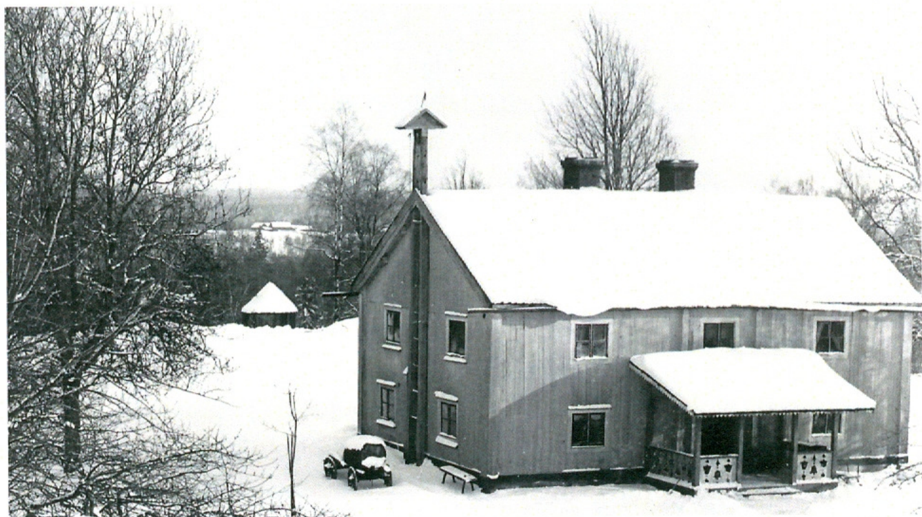
Statarbostaden på Öringe. Cirka år 1900.

Tre barn tillhörande en statarfamilj innebrända