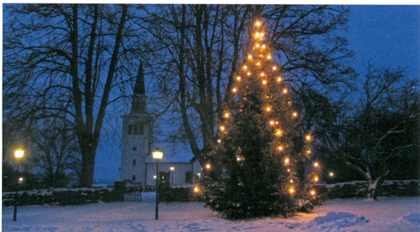
Mabäck julen 2012.