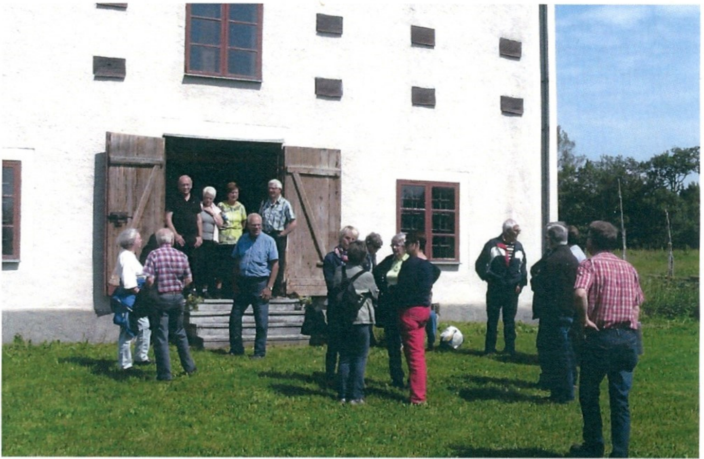
Gårdsvandring i Herrestad 2012. På bilden besöker sällskapet Gårdsmagasinet.