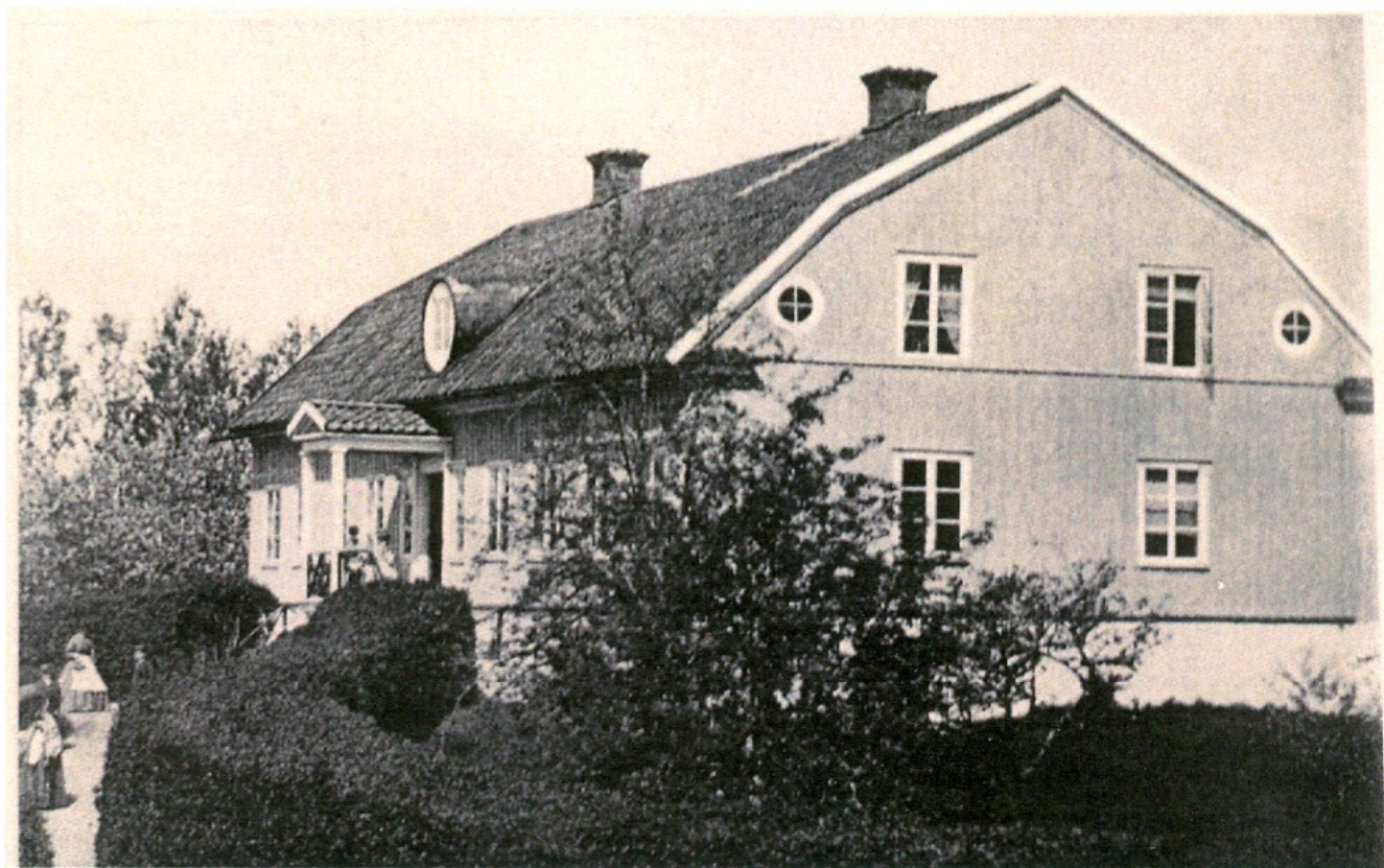
Öringe huvudbyggnad 1868.