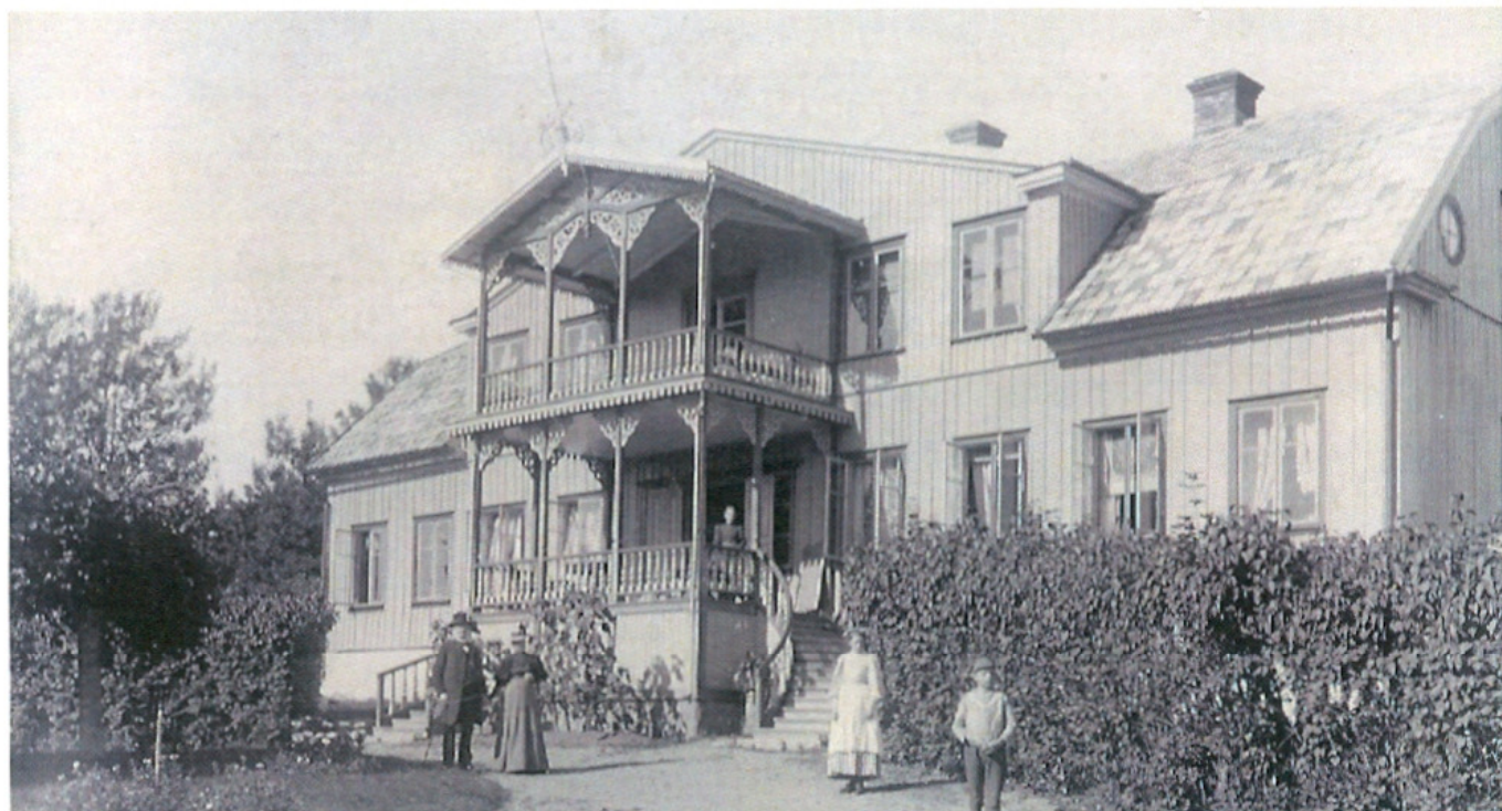
Öringe huvudbyggnad cirka år 1900.