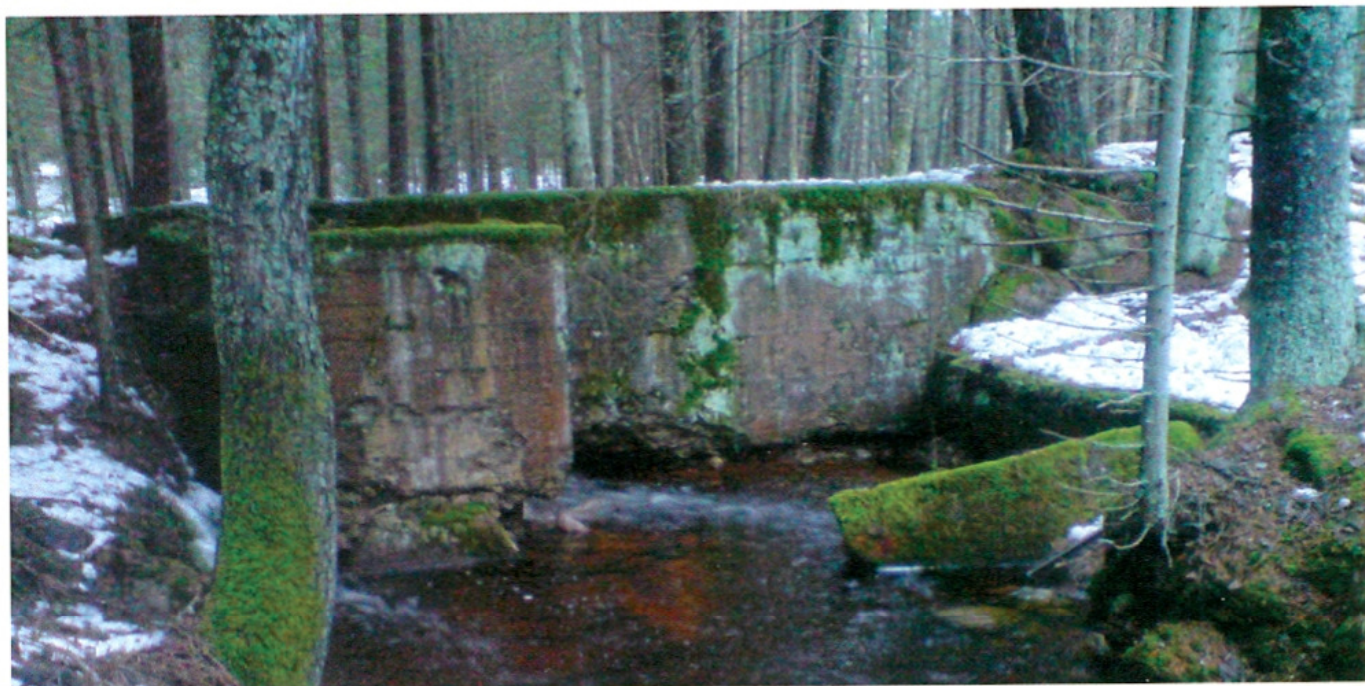
Rester av dammfästet till kraftstationen i Fagerhult.